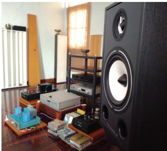
BR03 with Viola Audio : SE3 (Upgraded OPT) SINGLE - END Tube Amplifier 12BH7A + EL84 in My Listening Room (4.5m x 9m)