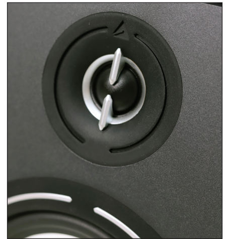
โดมตัวใหม่ที่ติดตั้งระบบกระจายเสียงล่าสุด EFS (Efficient Flow System)

คู่มือระบุตำแหน่งวางล้าโพวงว่าควรโอบอ้อมหน้าเข้าหาจุดนั่งฟังเพื่อให้มุมกระจายเสียงครอบคลุม โดยไม่มีเสียงสะท้อนจากผนังด้านข้างเข้ามาจนมากเกินไป นั่นว่าควรเซ็ตอัพแบบ Nearfield ให้ระยะห่างล้าโพวงช่วยชดเชยเท่ากับระยะห่างจากระนาบล้าโพวงถึงจุดนั่งฟัง ซึ่งหลังจากผมลองหาดำแหน่งแล้วฟัง พบว่าระยะที่คู่มือแนะนำนั้นเหมาะสมที่สุด แล้วโอบอ้อมหน้าเราละจึงพอดีตอบได้ว่า “ขึ้นอยู่กับขนาดห้องและระยะห่างของล้าโพวงในห้องคุณ” คู่มือระบุตัวเลขข้างต้นมากกว่า 2 ม. ซึ่งสอดคล้องกับตำแหน่งของ BR03 ที่ผมเซ็ตในห้องฟัง (มากกว่า 3 ม.) จุดเริ่มต้นที่ทำให้ BR03 จำลองเสียงได้กว้างมาจากตัวขับเสียงที่สอดคล้องกัน ไม่ต่างจากพระเอกคู่นางเอก โดยมีพระรองมาเพิ่มสีสัน