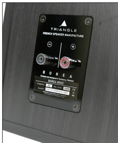
ข้อต่อปรับโพสดีสวยงามงานเนียบ หมุนคลายง่ายและแน่น

ล้าโพวงที่ผมได้มาน่าจะผ่านการใช้งานมาแล้ว นั่นคือผมไม่ต้องเสียเวลาทะลวงใส่ในหลายวัน ฟังแล้วรู้เรื่องเลย (รับอินคูใหม่แกะกล่องอย่างน้อยควรฟัง 150 ชม. ขึ้นไป) เนื่องจากซีรีส์ BR สร้างชื่อเสียงให้ตัวแทนจำหน่าย และเพิ่มคะแนนนิยมให้ต้นสังกัดมาระยะหนึ่งแล้วในแวดวงออดิโอไฟล์บ้านเรา จะว่าไปแนวโน้มสเปคดนตรีจากล้าโพวงเล็กที่ครบเครื่องนับว่าเป็นทางเลือกสุดคุ้มตอนนี้ ยุคที่เงินทองหายากพอกับสุดอากาศดีเข้าปอด ผู้ผลิตรายใดส่งน้องเล็กสเปคดีขายได้ทั่วโลกก่อน ย่อมรับทรัพย์ก่อน เหนืออื่นใดคือคนฟังแฮปปี้ ได้ของดี ฟังเสียงดีไปอีกนาน ใครเล็งล้าโพวงไว้และคิดแบบนี่ถือว่าเข้าทาง BOREA และหากตั้งมั่นว่าชอบและอยากได้ล้าโพวงเล็กที่พร้อมเปล่งเสียงใหญ่ไม่แพ้ล้าโพวงใหญ่ล่ะก็ กาลิสต์ BR03 ไปได้เลย